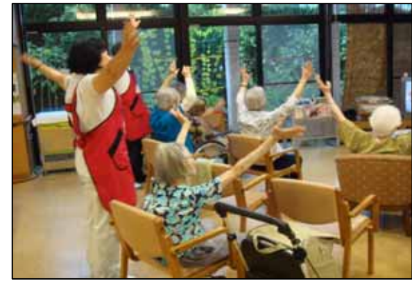
시설 이용자와 함께 레크리에이션 참가(실습)