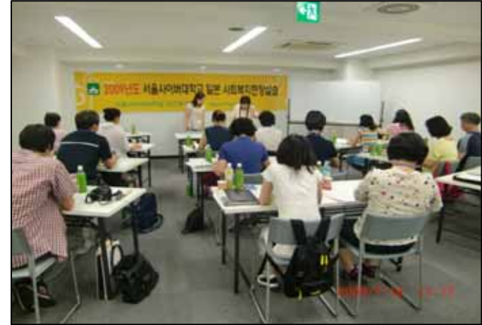
일본의 개호(노인요양)보험제도 및 고령자 시설의 이해(강의)

한국의 지자체나 대학, 고령자 시설 등에서 파견된 다수의 시찰·연수생에 대해 실습을 실시하고 있습니다.