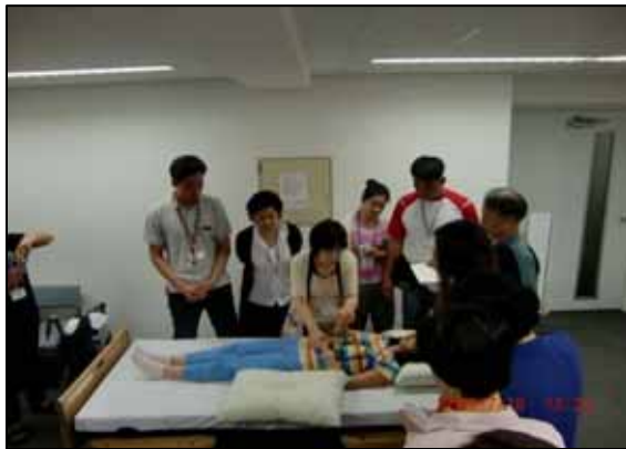
체위변경 시의 보조방법(실기)