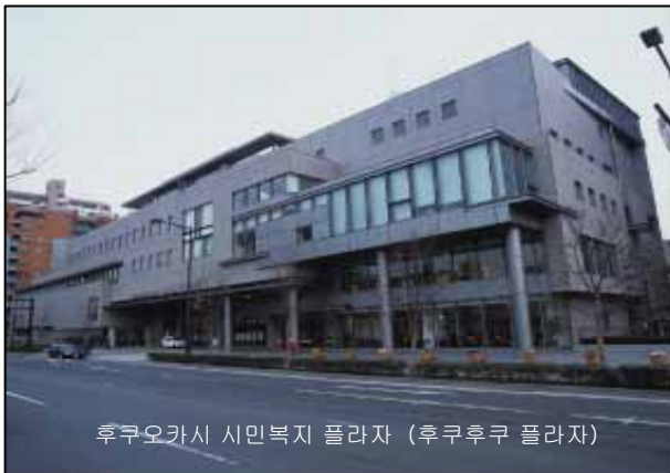
후쿠오카시 시민복지 플라자 (후쿠후쿠 플라자)

복지에 대한 시민의 이해와 복지활동에 대한 시민참가를 촉구하는 것에 의해, 상호 협력하여 도움을 주고 받는 복지사회의 실현을 목적으로 하는 시민복지 종합시설