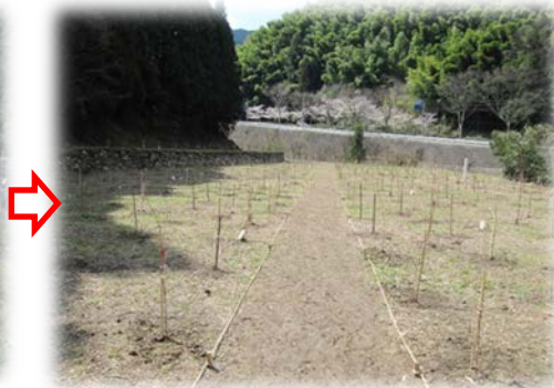
ソメイヨシノなどの広葉樹 600本を社員や地元住民の皆さんと協力して植樹しました（平成22年）。