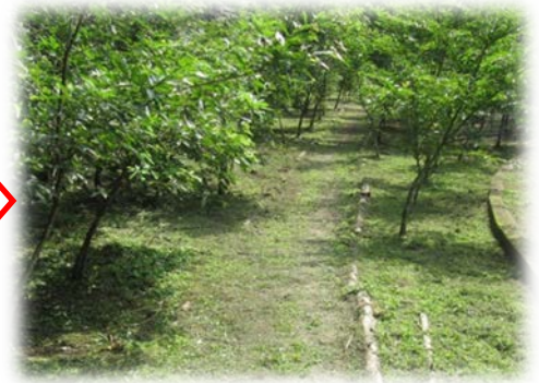
そして5年後、今はこんなに大きくなりました。