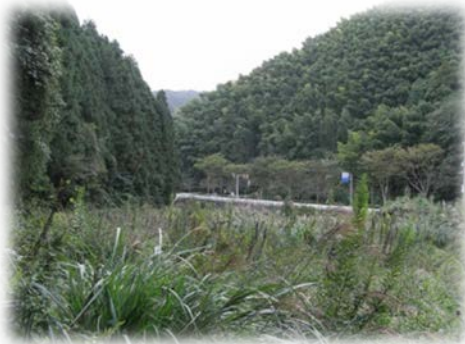
植樹活動地の植樹前（平成21年）の状況。雑草におおわれた土地でした。