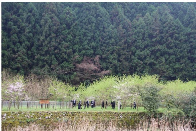
(写真3：「カローラ福岡の森」概況)