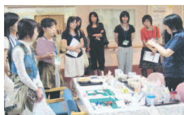
ふくふくプラザを見学(昨年)

市の施設(海水淡水化センター、橋本車両基地など)をバスで見学するグループを募集します。日時、見学施設は相談に応じます(2、3か所程度の見学が可能)。昼食は各自で準備してください。期2月~3月の月~金曜日(祝日を除く)午前9時半~午後4時 区内で活動している20~40人のグループ定抽選で1組料無料問区地域振興課(☎833-4307 F846-2864) 申往復はがきにグループ名、グループの人数と代表者の住所、氏名、年齢、電話番号を書いて1月20日(水)必着で同課「施設見学会」係(〒814-8501住所不要)へ。