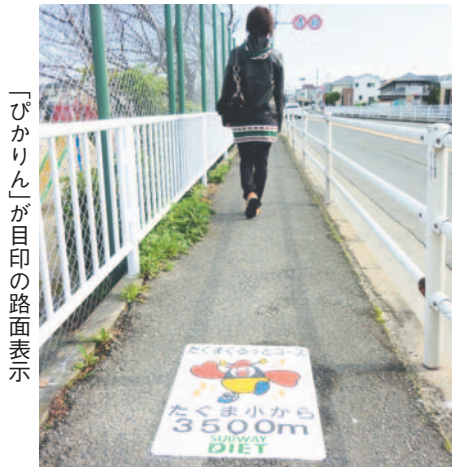
「ぴかりん」が目印の路面表示

【問合せ先】 区地域保健福祉課(☎833-4363 F846-2864) 申往復はがきに住所、氏名、電話番号を書いて1月22日(金)必着で同課(〒814-8501住所不要)へ。