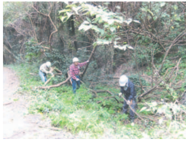
保全活動に汗を流すボランティア(昨年11月)

☎1月9日(土)、2月16日(火)。いずれも午前10時から午後3時まで。1日のみの参加も可。志賀海神社駐車場集合。作業が可能な服装で。☎健康保険証(コピー可)、軍手、タオル、飲み物、弁当。 ☎15歳以上 ☎各日程20人 ☎メール、ファクス、電話で、参加者の住所、氏名(ふりがな)、年齢もしくは年代、性別、電話番号、メールアドレスを下記の事務局へお知らせください。締め切りは各日程の4日前。