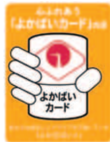
このステッカーが協力店の印!

各シニアクラブ(老人クラブ)では会員を募集しています。会員はさまざまな活動への参加に加え、約400店舗の協力店で価格の割引や景品などのサービスが受けられる「よかばいカード」を利用することができます。加入についてのお問い合わせは、区シニアクラブ連合会事務局(区福祉・介護保険課内☎559-5129 F512-8811)へ。