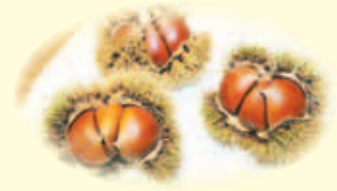
▲花畑園芸公園のクリ

期=日時、開催日、期間 所=場所 問=問合せ F=ファクス 対=対象 定=定員 料=料金、費用 託=託児 申=申込み 開=開館時間 休=休館日