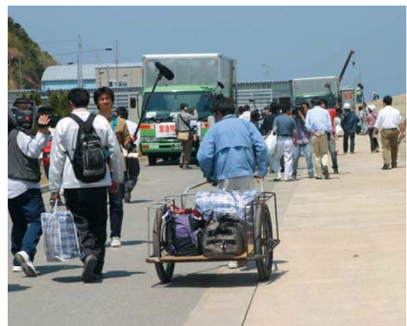
避難所から仮設住宅へ