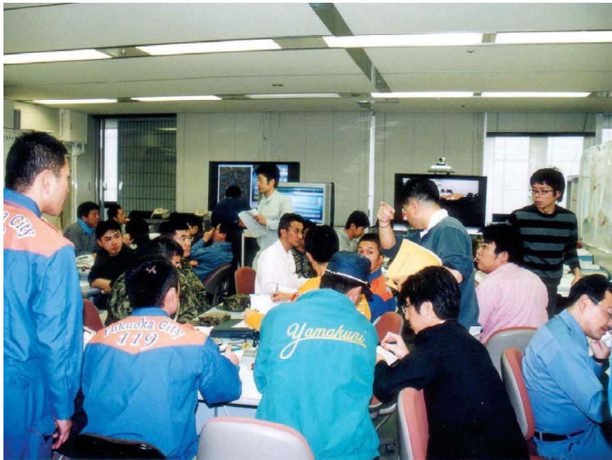
福岡市災害対策本部