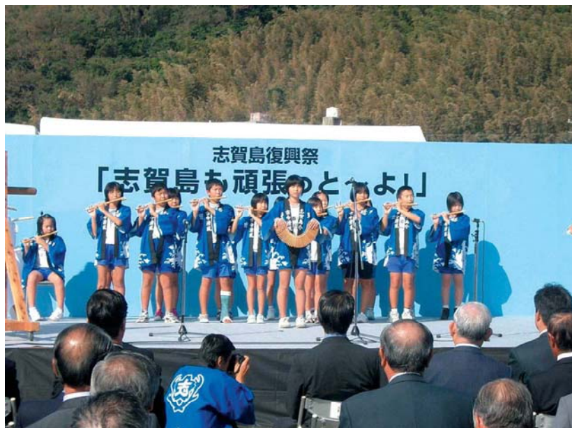
志賀島復興祭で横笛を演奏する志賀小児童