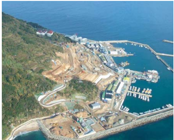
復興が進む玄界島