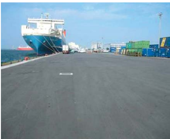
復旧が完了した岸壁(箱崎ふ頭)