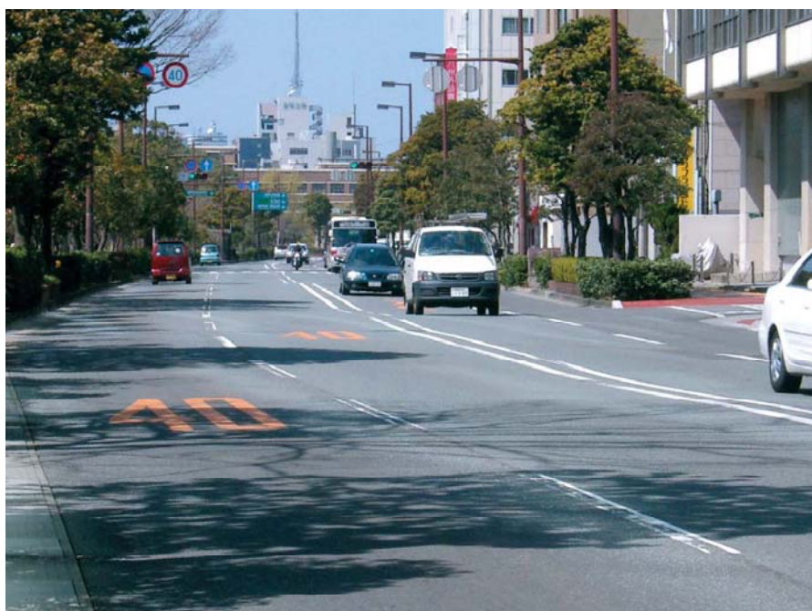
大きくうねった道路(明治通)