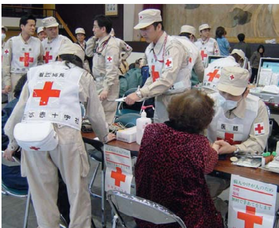
避難所における診療(日本赤十字社)