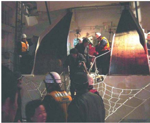
海上保安部巡視船による避難