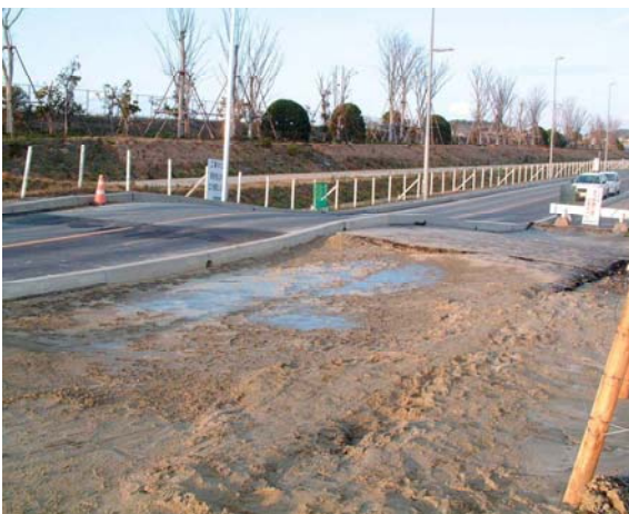
道路の隆起(アイランドシティ地区)