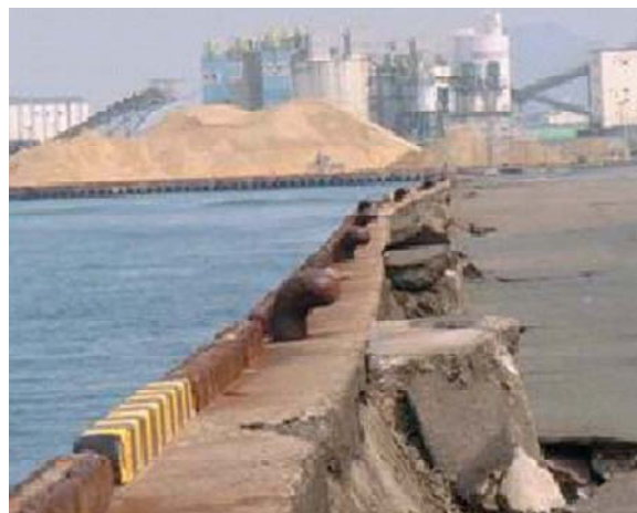
岸壁のはらみだし(中央ふ頭地区)