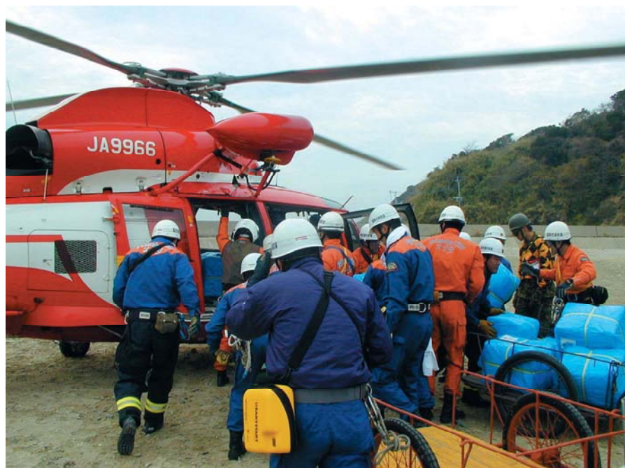
消防ヘリによる緊急物資輸送