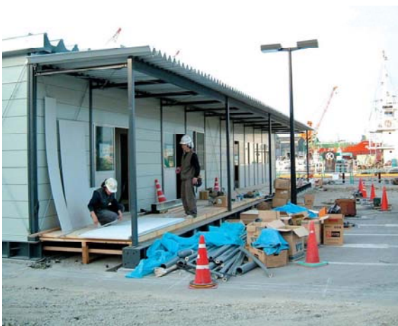
仮設保育所の設置(かもめ広場)