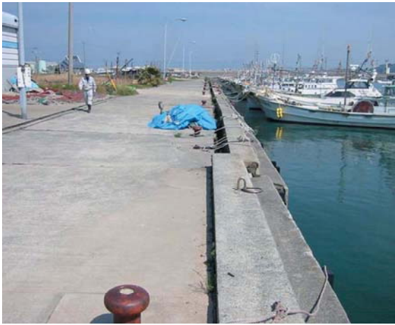
被害を受けた岸壁(志賀島漁港)