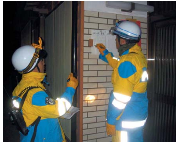
福岡県警による夜間パトロール