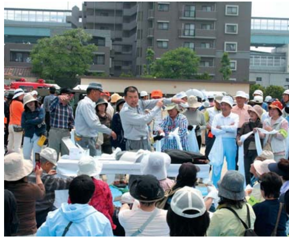
地域での防災訓練への取り組み