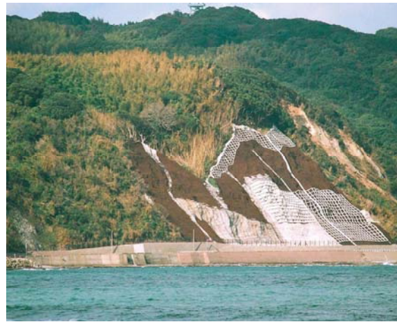
復旧が完了したのり面(東区志賀島)