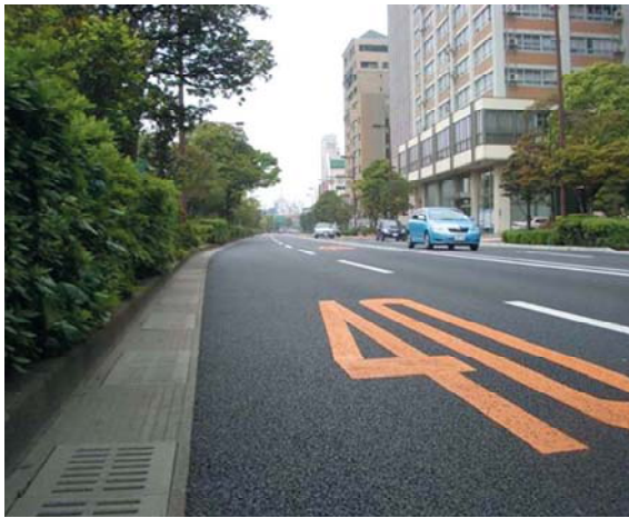
復旧が完了した道路(明治通)