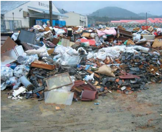
被災ゴミの集積(西区西浦)