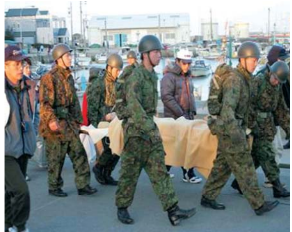
自衛隊による避難支援