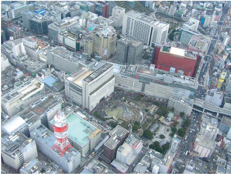
都心の公園へ避難した人々(中央区天神)