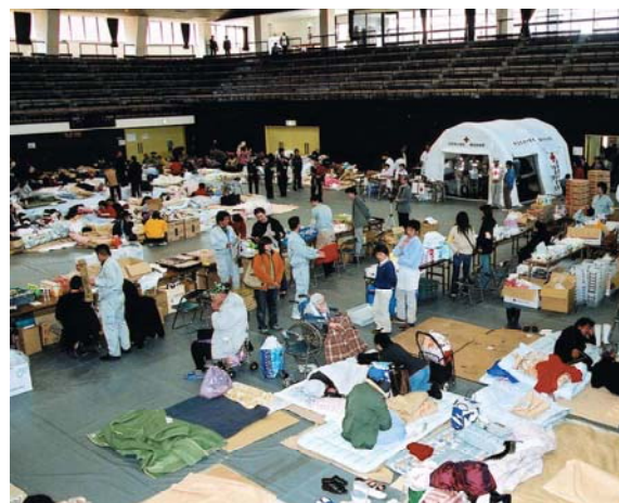
避難所内の救護所