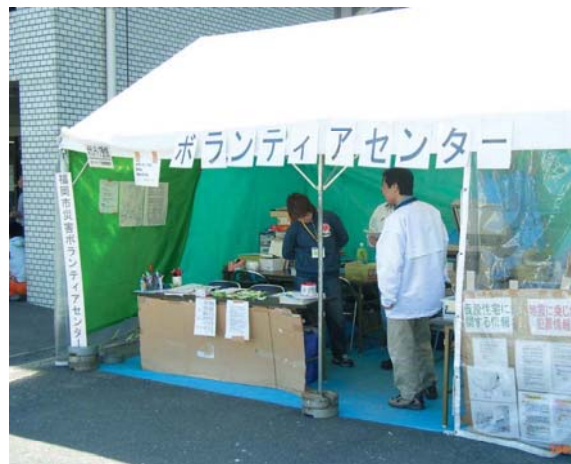
ボランティアセンター(中央区)