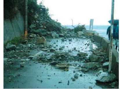
大規模ながけ崩れ(東区志賀島)