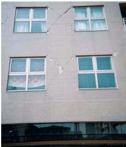
被害を受けたマンション(中央区)