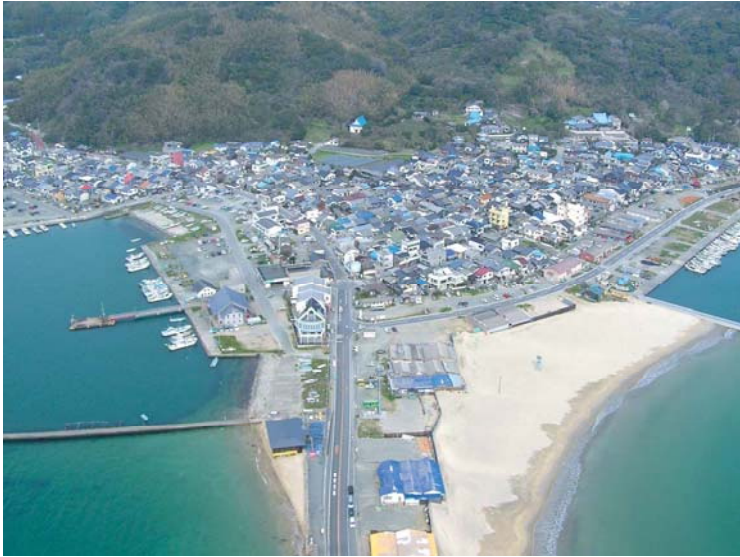
大きな被害が集中(東区志賀島)