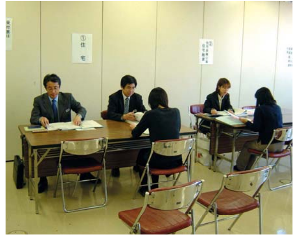
被害者相談窓口(西区役所)