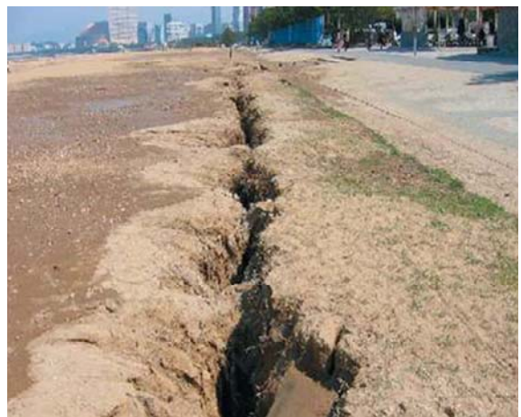
海浜公園の地割れ(早良区)