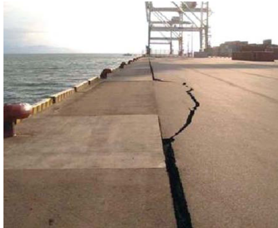
エプロンのクラック(アイランドシティ地区)