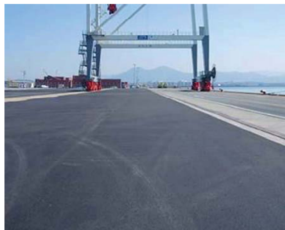
復旧が完了した岸壁(アイランドシティ地区)