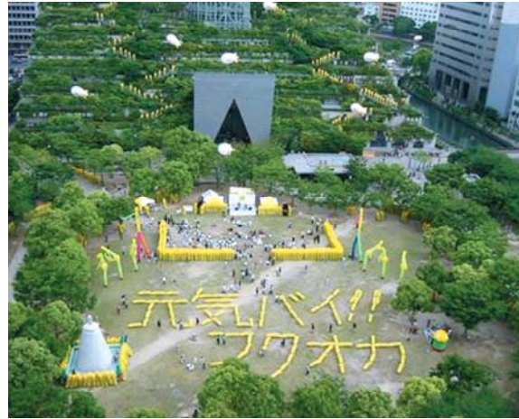
元気バイふくおかキャンペーン