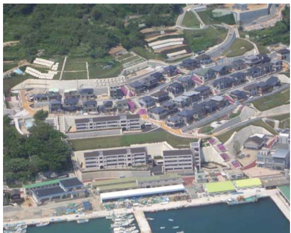
復興が完了した玄界島