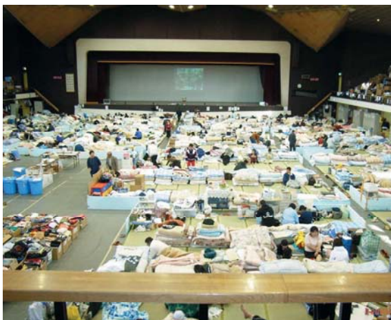
避難所となった九電記念体育館