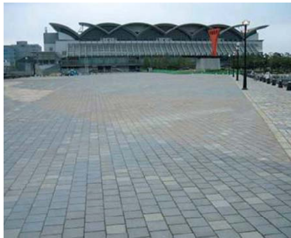
復旧が完了したイベントバース(中央ふ頭地区)