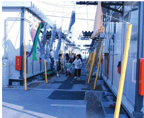
仮設住宅(かもめ広場)