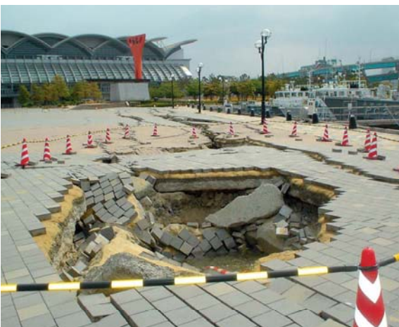
イベントパース(中央ふ頭地区)