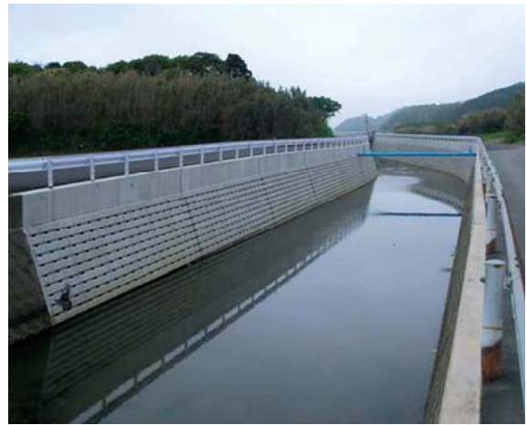
復旧が完了した河川(大原川)