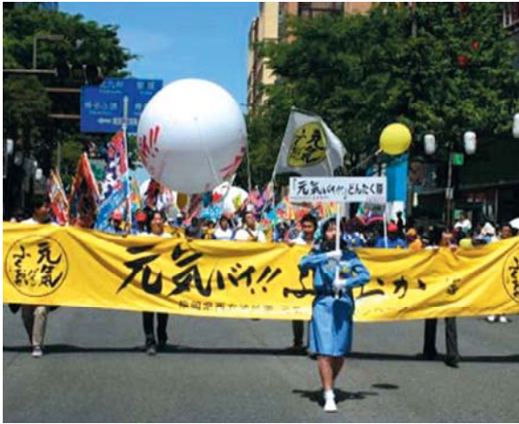
どんたくパレード