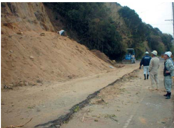
のり面の復旧工事(東区志賀島)