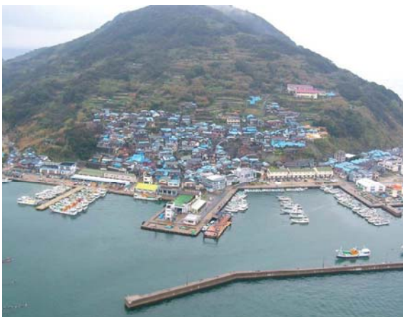
ビニールシートに覆われた被災家屋(西区玄界島)