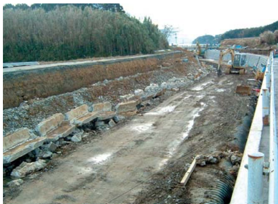
河川の復旧工事(大原川)