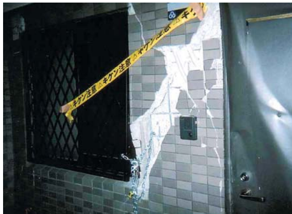
被害を受けたマンション(中央区)