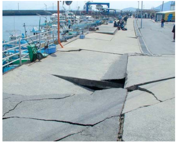
被害を受けた岸壁(玄界島漁港)