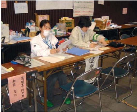
避難所での健康相談