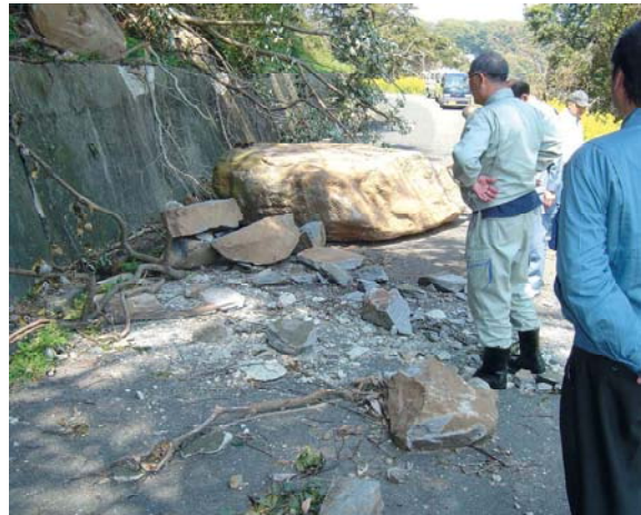
道路への落石(西区能古島)