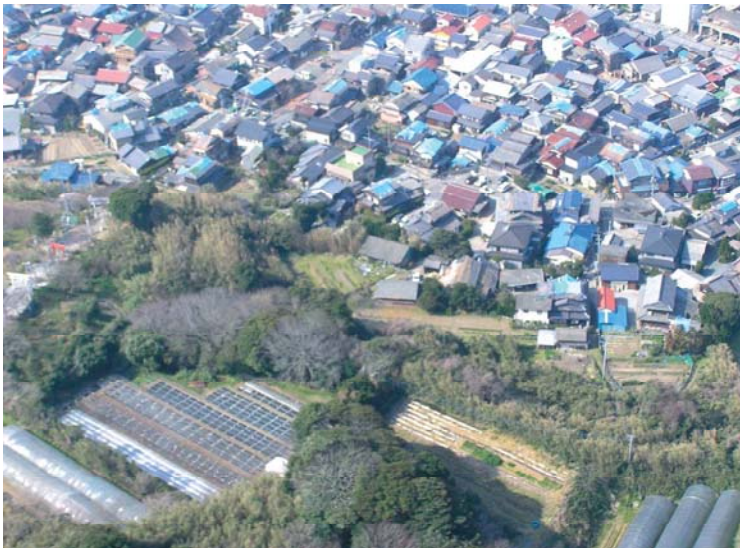
大きな被害が集中(西区西浦)