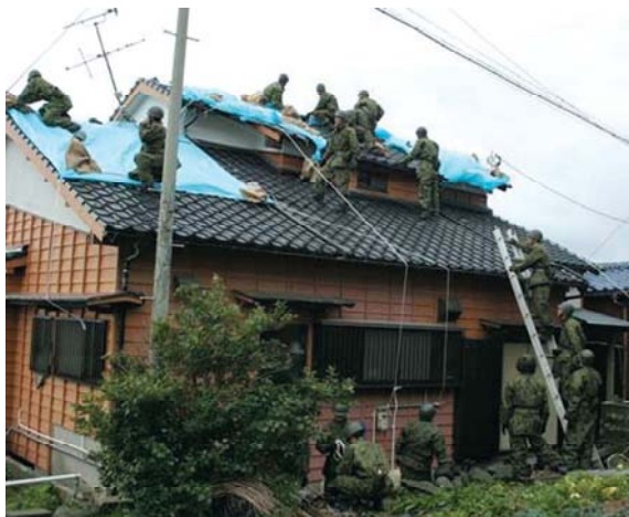
自衛隊によるビニールシート張り