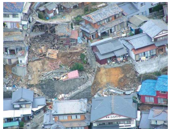
倒壊した民家(西区玄界島)