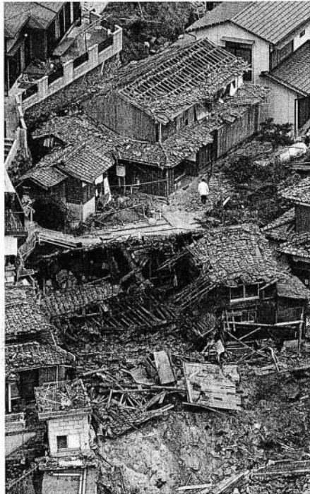
地震の激しい揺れで倒壊した住宅 (20日午後0時44分、福岡市西区の玄界島で、本社へりから)