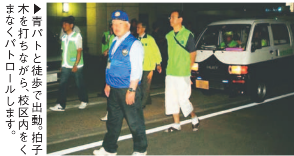
▶青パトと徒歩で出動。拍子木を打ちながら、校区内をくまなくパトロールします。

地域の防犯力を高める必要があり、一人ひとりの防犯への心掛けはもちろん、地域住民や市・警察など、社会全体で地域の防犯力を高める必要 まちぐるみの防犯活動は、犯罪を抑制する力になります。区内の各地域では、住民による防犯組合や団体が、地域の特性・実情に合わせて、パトロールや登下校の見守り、街の環境美化、防犯教室などさまざまな活動に取り組んでいます。 地域の安全を見守る 吉塚 吉塚校区では、毎週校区内のパトロールを実施しています。メンバーは、防犯委員や自治会、パトロール隊(小・中学校PTAやおやじの会)、消防団などさまざま。それぞれ