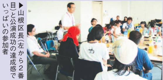
▶山根区長(左から2番目)と公演成功の達成感でいっぱい参加者