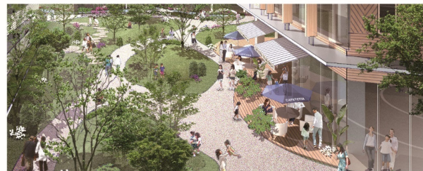
ネイチャーガーデン～オープンカフェ