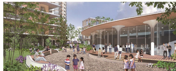
コミュニティガーデン～コミュニティハウス

※提案時における優先交渉権者の主な提案内容であり、今後の協議等により変更になることがあります。