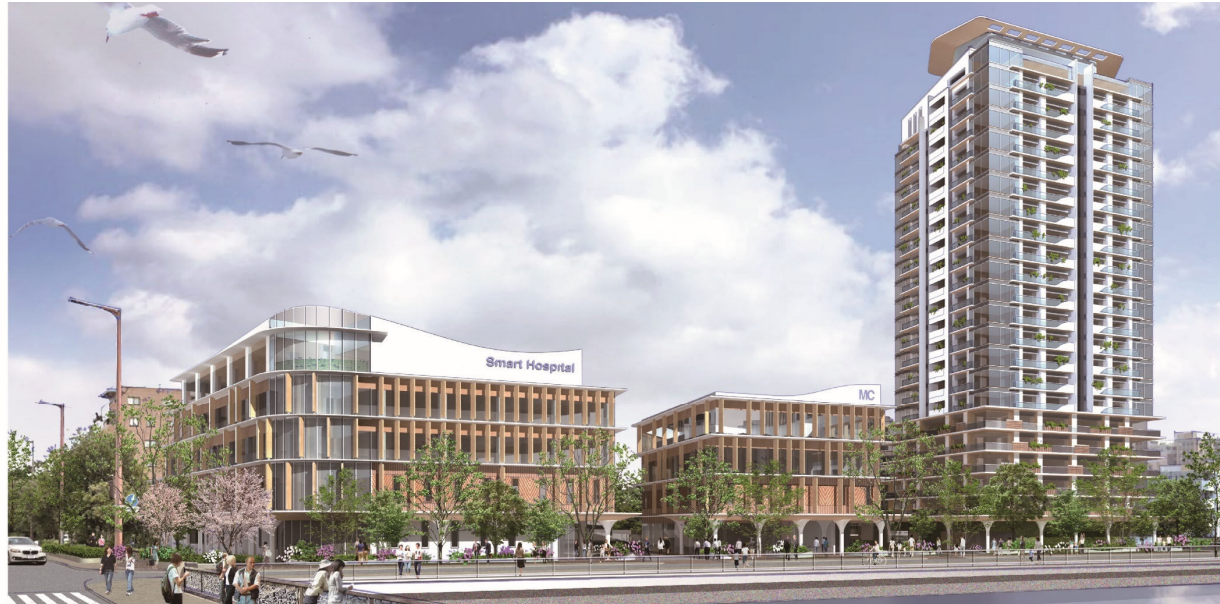
よかトピア通りから