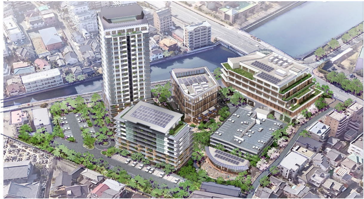
南東からの鳥瞰図