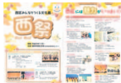
昨年のリーフレット

【内容】10月～12月に区内で実施する文化関連行事【部門】音楽・舞踊・民舞・演劇・演芸、文芸、茶華道、映像、美術、自然、歴史、その他 申部門名、行事名、日時、会場、内容(資料があれば添付)、参加費の有無、主催者名、問合せ先の住所、電話番号を書いて、郵送、ファクス、またはメールで7月31日(金)(必着)までに区地域振興課(〒819-8501住所不要 ☎895-7037 F882-2137 メールt-shinko.NWO@city.fukuoka.lg.jp)へ。