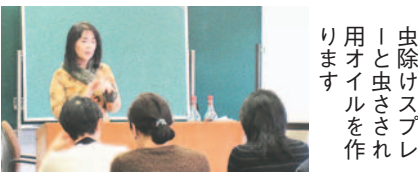
虫除けスプレーと虫さされ用オイルを作ります

園芸講座～ハーブの効用1～ 開7月15日(水)午後1時半～3時半 定30人 料1,000円(入園料別) 申往復はがきで7月1日(必着)までに同園へ。ホームページからも受け付け。