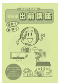
役立つ情報をお届け

民相談室や市民センター、各公民館、情報プラザ(市役所1階)などで配布しています。 申込要領など詳しくはテーマ集か市ホームページをご覧ください。