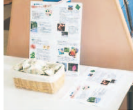
朝顔の育て方を説明したチラシも置いてあります

(小学校低学年は保護者同伴)定各8人 料500円 申往復はがき(1人1枚)で5月15日~6月10日(必着)に同プラザへ。「朝顔のカーテン」プロジェクトで採れた朝顔の種を差し上げています。昨年、市役所などで取り組んだ同プロジェクトで採れた種を差し上げています。先着2,000包(1包当たり20粒入り)。1人1包でお願いします。開温暖化対策課 ☎711-4282 F733-5592 料無料 申不要