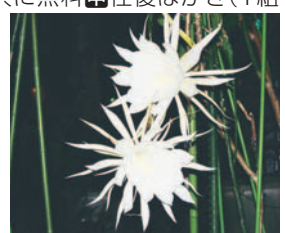
2日間だけ美しさを観賞できる月下美人

月下美人の開花の様子を観察。開花調査により開催日を決定し、当選者へ開催前日に連絡します。6月～7月の2日間午後7時半～10時(予定) 定50組150人 料入園料、駐車料共に無料 申往復はがき(1組1枚)に参加者全員の応募事項と代表者名、ファクス番号を書いて5月25日(必着)までに同園へ。ホームページからも受け付け。