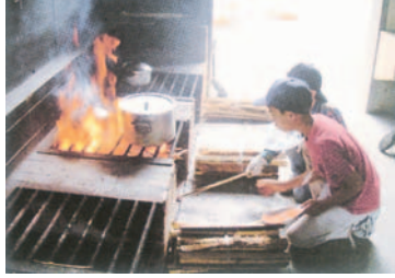
みんなで作った料理の味は格別

夏休み期間中(7月18日～8月30日)の利用受け付け 夏休み期間は、宿泊利用のみ受け付けます(日帰り不可)。