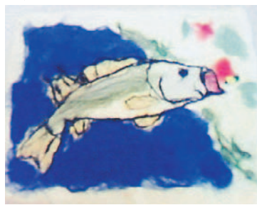
ふわふわの羊の原毛で絵を作ります

6月13日(土)午前10時40分～午後1時40分 対子どもと保護者 定12組 料1組1,000円 申往復はがき(1人1通)に応募事項と性別を書いて6月8日(必着)までに同牧場へ。