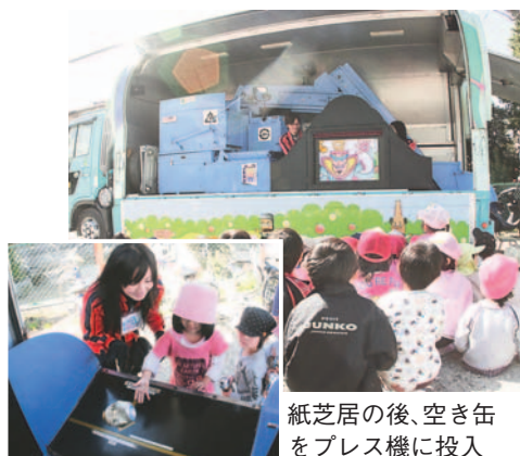
紙芝居の後、空き缶をプレス機に投入

【問合せ・申込み先】 家庭ごみ減量推進課 (☎711-4346) fukuoka.jg.jp