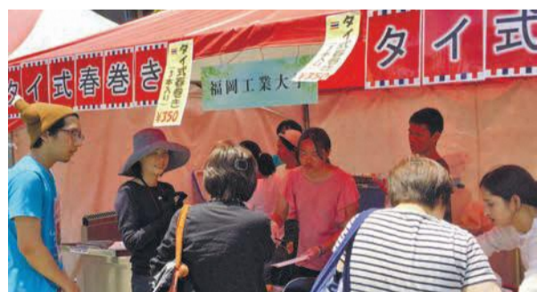
にぎわう並木広場のバザー(昨年)

【同時開催】博多七五三吉(しめきち)おはじき彩色体験(☒なでしこルーム☒午後1時～4時)。 ※来場の際は、公共交通機関をご利用ください。 最寄駅:西鉄電車「西鉄千早」駅・JR「千早」駅・西鉄バス「名香野」「千早駅」バス停