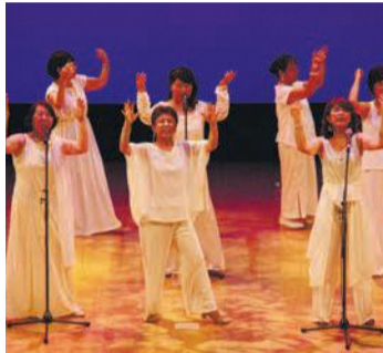
昨年のステージ(第2部)

のステージ(第2部)は観覧自由です。ひまわりひろばでは、区民が撮影した写真のコンテストを開催し来場者も投票できます。また、「G20 福岡」開催を記念して、パネル展示を行います。