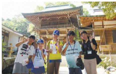
安曇野市の子どものまちとの交流(平成29年度)

市内と一緒に宿泊し、福岡タワー見学やカヌー体験などを通じて交流を希望する小中学生を募集します。期7月30日(火)～8月2日(金)の3泊4日(期)区内に住み、全行程に参加できる小学5年生～中学2年生(期)10人(期)10,000円(期)指定の申込書に必要事項を書いて、郵送または持参(平日午前9時～午後5時)で問い合わせ先へ。6月7日(金)必着。詳しくは、区ホームページ(「安曇野市との青少年交流事業」で検索)や東区役所、区内各公民館等で配布する募集要項をご確認ください。応募多数の場合は選考。区企画振興課(〒812-8653住所不要) ☎645-1037 ㊟651-5097