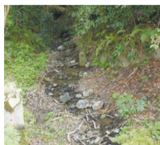
今も流れる天龍川

海神の総本山である志賀海神社は、神代より「龍の都」と呼ばれています。この神社には、第61代朱雀天皇のご宸筆『照龍』の扁額Ⅱ左写真Ⅱがあります。朱雀天皇の治世中(930～946)は、富士山の噴火、地震、洪水など数多くの災害や、各地で豪族・貴族の反乱が起きました。志賀島が起きました。志賀島は、これを憂いた天皇が『照龍』額を奉納し、雨乞いの祈願祭を行いました。すると、境内横を流れる龍天川(現在は天龍川)から白龍が天に昇り、雨が降ってきたそうです。この扁額は掛け軸に仕立てられ、非公開ですが志賀海神社の社宝として今も大切に保存されています。