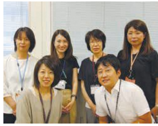
気軽にご相談ください(子育て支援課)

区子育て支援課では、電話や窓口で子育てに関する相談を受け付けています。同課とも相談係の阿