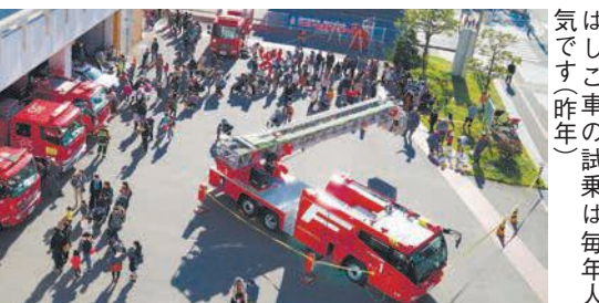
はしご車の試乗は毎年人気です(昨年)

はしご車の試乗や防火服の試着体験など、親子で楽しめるイベントを開催します。雨天、災害出動時は内容を変更する場合があります。期11月3日(日)午後2時～4時所東消防署(千早四丁目) ※駐車場はありません。対はしご車試乗のみ4歳から小学生まで(先着40組。午後1時50分から整理券配布) 料無料 問東消防署予防課 ☎683-0119 ☎683-1129