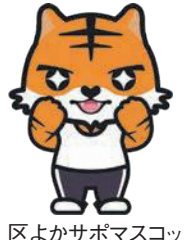
区よかサポマスコットキャラクター「よかトラくん」