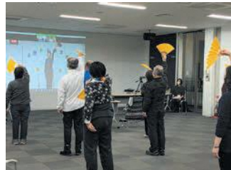
よかトレを学ぶ実践ステーションの代表者

参加者は「コロナ禍で人数制限しながらも、毎週活動を続けてきました。近所の人と顔を合わせて運動することが楽しみです。また、指導者から教えてもらった体操は簡単にできるので、家でも習慣になっています」と話しました。