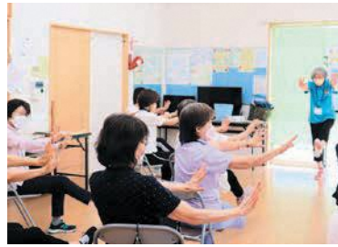
指導者と一緒に体を動かす参加者

育児をテーマに、パパ同士で楽しく交流しながら学び合います。☎9月3日(土)、11日(日)、10月30日(日)の午前10時～正午 所なみきスクエア(千早四丁目) 対0歳から3歳までの乳幼児の父親 定各回先着10人 料各回1,000円 託無し 申8月1日(月)午前10時以降に、メール・電話・ホームページ(「なみきパスクール」で検索)で住所・氏名・電話番号・参加希望回を記載して問い合わせ先へ。☎なみきスクエアCLUB(クラブ)事務局 ☎542-0224 info@kodomo-abc.org