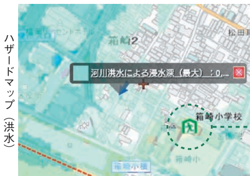
ハザードマップ(洪水) 浸水する危険のある区域が着色されています 選択した地点の詳細情報(浸水の深さ)が表示されます 周辺の避難場所の位置が表示されます