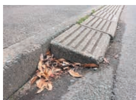
乗り入れブロック

歩道と車道の段差解消のために乗り入れブロックや鉄板を設置することは、法令で禁止されています。