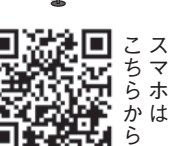
スマホはこちらから