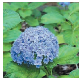
菅崎宮あじさい苑(6月開園)のアジサイ(昨年撮影)