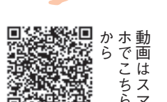
動画はスマホはこちらから