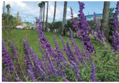
かしいかえんのアメジストセージが見頃です