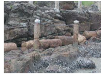
中央に横たわる帆柱石は満潮時には水没する

定されました。約3500万年前のカシ属の樹木が化石になったもので、長さ10m、直径60cmの円柱形の細長い石が9個に折れた状態になっています。