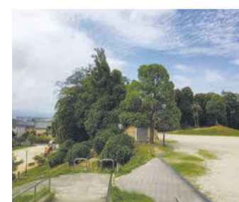
緑豊かな香椎台おいの山公園

大槨は下段の広場の奥にあります。樹齢四千年といわれるこの木は、幹が数本に分かれ、近くで見ると迫力があります。