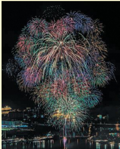
鮮やかな花火が夜空を彩ります

東区花火大会実行委員会主催の「第28回Fukuoka東区花火大会」が来年4月25日(土)に、香椎浜海岸で開催されます。詳細は、決まり次第同委員会のホームページでお知らせします。