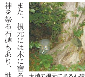
大槨の根元にある石碑