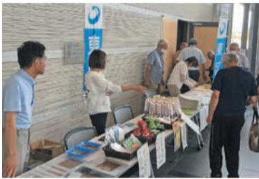
昨年8月に安曇野市で開催した志賀島特産品の販売会

前5世紀ごろ呉越戦争で越に敗れた呉の人々が、北部九州に渡ってきました。彼らは「安曇族」と呼ばれ、志賀島を拠点に中国大陸や日本列島で交易を始めました。志賀海神社の宮司家は歴代、阿(安)曇姓だといわれています。日本各地には、志賀・安曇にゆかりのある地名が30カ所以上あります。