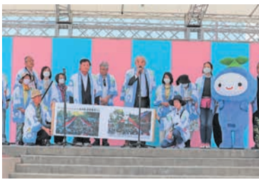
東区演舞台に参加した安曇野市どんたく隊

志賀島は、古くから漁業や海運業に従事する海人の根拠地として、また国内外を行き交う海上航行の要所として知られていました。志賀島南側の小高い山にある志賀海神社は、海を守る神社として知られ、2世紀ごろに創建されたといわれています。中国春秋時代の紀元