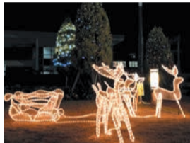
北門周辺などで開催

夜の九州産業大学がイルミネーションで彩られます。📅12月4日(月)～1月20日(土)の午後5時～9時📍同大学(松香台二丁目) 🗨️同大学理工学部事務室 ☎673-5400