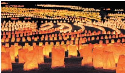
過去のキャンドルナイト

「みんなで作る1万本のキャンドル・アート」をテーマに海の中道海浜公園で「うみなかキャンドルナイト」を開催します。暖かく、やさしいキャンドルの明かりで幻想的な光景が広がります。光のSL機関車やミニコンサートなど、子どもから大人まで楽しめる企画も実施されます。