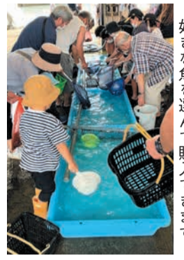
好きな魚を選んで購入できます

志賀島の近海で取れた新鮮な魚介類などを販売します。5月13日～12月23日の第2・4土曜日午後2時～ ※売り切れ次第終了 所弘漁港 市漁業協同組合弘支所 ☎603-6611 ☎603-2755