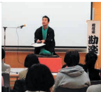
地域コミュニティ落語

見守りの体験談や地域活動のクイズを通じて、地域のことや活動内容について学びます。講師は民生委員などが務めます。※開催校区により内容が変わります。