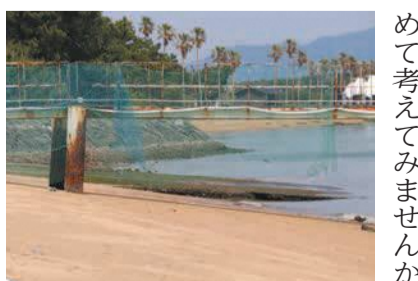
海に向かって伸びる「すべり」

昭和初期頃、旧日本海軍は各地に練習航空隊を開設しました。昭和15(1940)年、西戸崎にも水上機の練習航空隊が設置され、「博多海軍航空隊」と呼ばれたコンクリート製の斜路など、当時の面影が残っています。現地を訪れ、平和について改めて考えてみませんか。