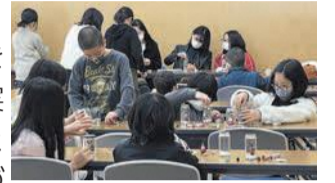
大学との共働による 公民館活動

自治会・町内会を対象にした事業を実施し、町内会長等との顔の見える関係づくりを推進します。また、オンライン活用や広報支援など、地域のニーズに応じた細やかな支援を行います。さらに、各校区のニーズを踏まえ大学やNPO・企業とのマッチングを行い、多様な主体による共創のまちづくりを推進します。