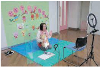
オンラインによる 子育てビギナース教室

子どもプラザの運営、子育て交流サロン・育児サークルなどの運営支援、子育て教室の開催を通して、地域での子育てを支援します。また、子育てに関する情報発信を行うほか、家庭の現状と子どもの人権に関する講座を開催します。