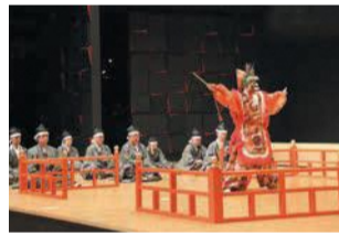
なみき芸術文化祭(昨年)

気軽に芸術文化に触れられる彩り豊かなまちづくりを進めるため、10～12月に東区芸術文化祭を開催し、関連情報も一体的に発信します。