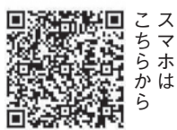
スマホはこちらから

区ホームページのウェルカメラネットを利用すると、市民課と保険年金課窓口の現在の 待ち人数を確認することができます。詳しく は、区ホームページ(「ウェルカメラネット」で検索)で ご確認ください。☎区市民課 ☎645-1016 📠632-0360