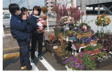
職員がパートナー花壇登録者を訪ね、花壇の魅力などを取材

📅=日時、期間 📍=場所 👤=対象 📄=定員 💰=料金、費用 📝=申し込み 🗨️=問い合わせ 📠=ファクス 📧=メール 🏠=ホームページ 📞=託児 🕒=持参 🕒=受付時間