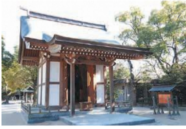
境内にある奉安殿