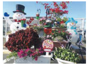
福岡ラインの花壇