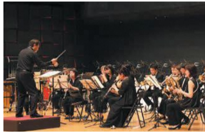
なみきホールでの演奏会(イメージ)

■応募締め切り 8月20日(金)午後5時(必着)。応募条件など詳しくは、区ホームページ(「かしいかえんでの思い出」で検索)または東区役所1階情報コーナー、なみきスクエア、コミセンわじろ(和白丘一丁目)で配布するチラシをご覧ください。☎区企画振興課(〒812-8653住所不要) ☎645-1037 ☎651-5097 ☎k-omode@city.fukuoka.lg.jp