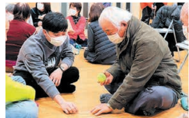
ボールを頭上に投げ、キャッチする間に床のお箸をとる遊びです

日本との暮らしの違いについては「バイクでの移動が主流のベトナムに比べて、日本は電車やバスなどの公共交通機関が豊富で移動しやすいこと」などを話しました。また、「手あそびをして盛り上がりました。楽しんでもらえてよかったです」と喜んでいました。