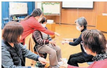
中国の留学生からも手あそびを習いました

日本との暮らしの違いについては「バイクでの移動が主流のベトナムに比べて、日本は電車やバスなどの公共交通機関が豊富で移動しやすいこと」などを話しました。また、「手あそびをして盛り上がりました。楽しんでもらえてよかったです」と喜んでいました。