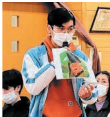
自国の料理を紹介する留学生

区は、今後も外国人居住者と地域住民が、交流を通じてお互いの違いを理解し合い、誰もが住みやすいまちになるよう、気軽に参加できるイベントを行っています。公民館での交流の情報は、公民館だよりで確認するか、区ホームページ(公民館だより)で検索)でご確認ください。