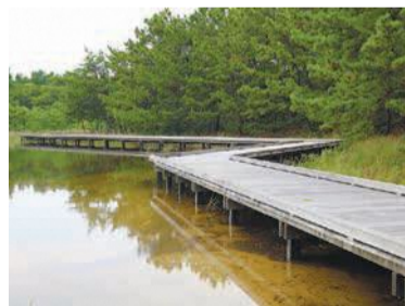
遊歩道を渡って水辺を散策できます

このエリアは両側が海に挟まれた細い砂州。『筑前国風土記逸文』には「この地に亀ヶ池、亀栖池あり。これ志賀大神を祀る所」と記載があり、この「幻の池」に神功皇后ゆかりの亀を祀るといわれています。 さんば会では、9月27日(日)に森の池エリアを巡るガイドツアーを行う予定です。詳細は同会加藤会長(☎090-6177-9478 📠603-6200)まで問い合わせを。