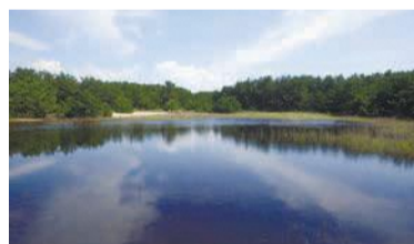
大雨の後、短期間だけ出現した池(令和元年9月撮影)