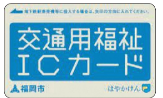
交通用福祉ICカード

ICカードの希望者には、交付額をチャージした新たなカードを郵送します。来年度以降も使用しますので、残額がなくなっても大切に保管してください。