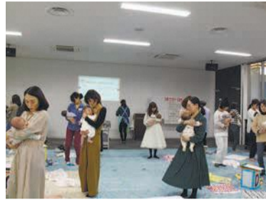
赤ちゃんとの「ふれあい遊び」