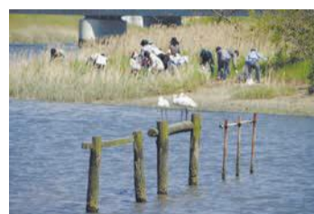
多々良川の清掃活動

川や海岸、山などで環境活動を自主的に行う団体に、用具の貸し出しや広報などの支援を行います。