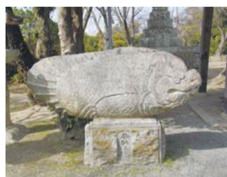
住民から寄進されたという珍しい魚の石像

平成29～30年度の「おすすめスポット」をまとめた「東区歴史街道を往くVol.5」を発行しました。東区役所、なみきスクエア(千早四丁目)で配布中です。問い合わせは区企画振興課(☎645・1012 ☎651・5097)へ。