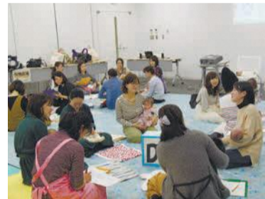
育児の話で会話がはずみます