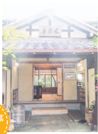
静かにたたずむ友泉亭