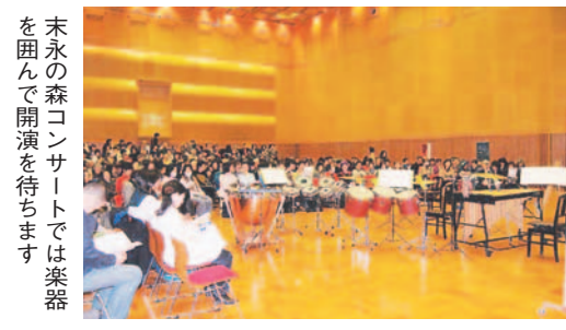
末永の森コンサートでは楽器を囲んで開演を待ちます

平成16年から九響と同センターが協力し、地域への感謝の気持ちを込めて「末永の森コンサート」を開催しています。演奏者を取り囲むように客席を作るので、来場者は間近で演奏を聴くことが出来ます。