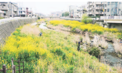
清掃や草刈りの成果か、昨年から一面に菜の花が咲くようになりました

度。自分たちの住むまちの歴史が感じられる日本庭園で、心と体をリラックスさせませんか。(友泉亭班取材・作成)