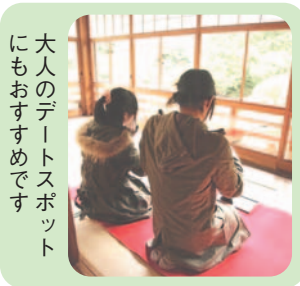
大人のデートスポットにもおすすめです

度。自分たちの住むまちの歴史が感じられる日本庭園で、心と体をリラックスさせませんか。(友泉亭班取材・作成)