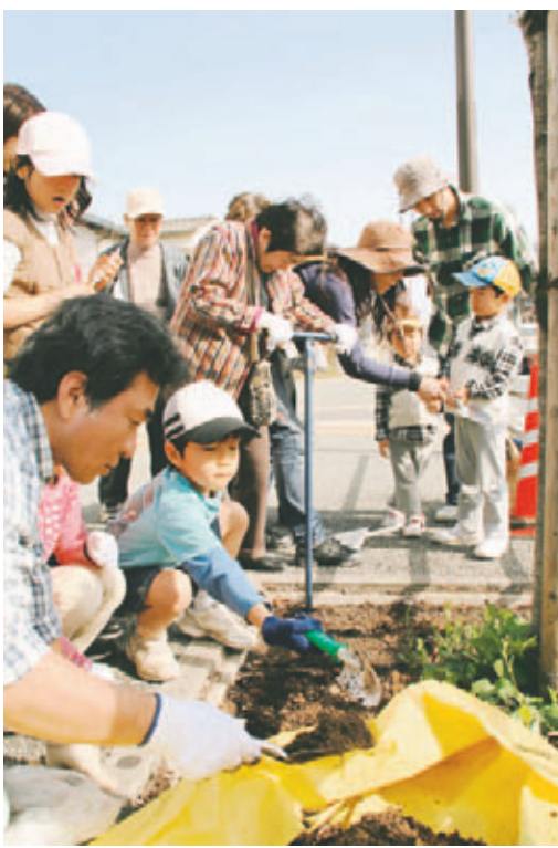
堆肥を混ぜると土がフカフカに

アビスパ福岡主催の6人制ミニサッカー大会。アビスパ福岡の選手やコーチとの触れ合いを楽しみませんか。終了後、サイン会もあります。 期28日(土)午後2時~5時 雁の巣レクリエーションセンター球技場B 区内に住むか通勤・通学する人 無料 ①はがきに参加部門(右記)、参加者全員の氏名(ふりがな)、年齢、代表者の住所、電話番号を書いて〒813-8585東区香椎浜三丁目21-1「アビスパ福岡サッカースクール事務局」へ。19日(水)必着。応募多数のときは抽選。 ☎同事務局☎674-3031