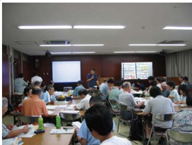
■ 水源林ボランティア講習会