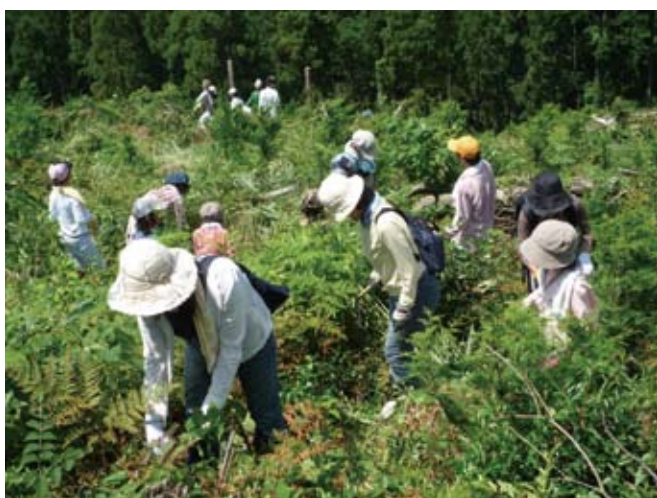
■ 江川ダム上流(朝倉市)での市民団体による下草刈り