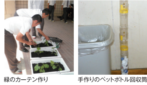
緑のカーテン作り 手作りのペットボトル回収筒

「健康な体づくりのためには環境問題を軽視できない」との考えから、保健委員会の生徒が自分達で、環境について自主的に学び、「ごみの減量と資源の有効活用方法」についての調査結果を福岡県高等学校保健会研究発表大会で報告した。また、保健委員が環境に関する様々な事案を定期的に校内で呼び掛けることにより、学校全体の環境保全活動への意識向上に繋がっている。その活動は校内のみならず、小・中学校での環境学習や西部3Rステーションのイベントに参加するなど校外へも活動の幅を広げている。