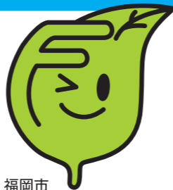
福岡市環境シンボルキャラクター「エコッパ」