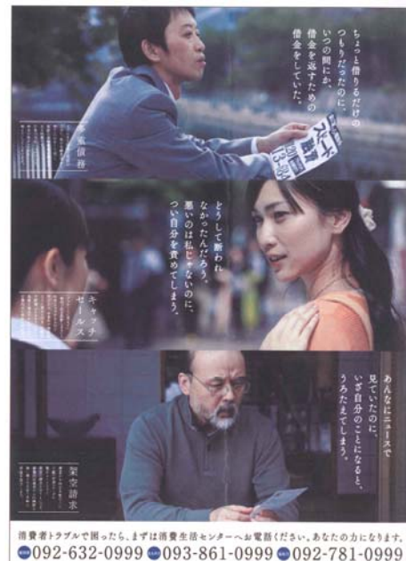
福岡市消費生活センターポスター