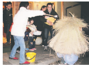
地域で受け継ぐ「石釜のトビトビ」

日(日)の午後6時半に石釜集会所を出発します。詳しくは内野公民館(☎804・8512)へ。