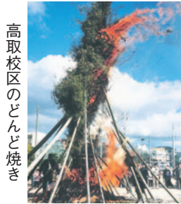
高取校区のどんど焼き