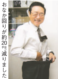
おなか回りが約20センチ減りました

区は、メタボリックシンドローム(内臓脂肪症候群)を予防するための自主的な取り組みを応援する「ウエストリーグ」を、昨年6月から半年間開催しました。英語で西や腹囲などの意味を持つウエストから名付けられたこの事業には108人の登録があり、各自の目標が達成できるよう生活改善に関する情報を提供してきました。登録者たちは、記録表を付けて管理栄養士や健康運動指導士などの助言を受けること