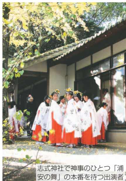
志式神社で神事のひとつ「浦安の舞」の本番を待つ出演者