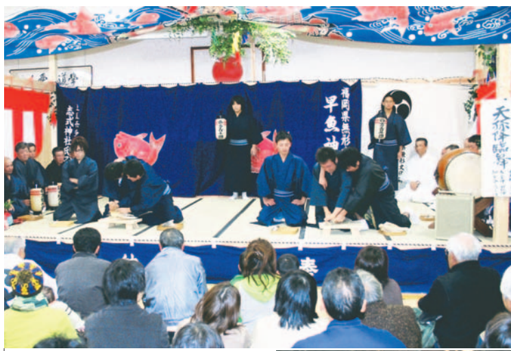
献魚包刀式(上)と「みそぎ」(右)

は12月30日(火)まで、年始は1月4日(日)から住民票や印鑑証明を取ることができます。詳しくは市民課(☎645-1016)へ。