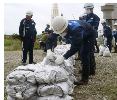
土のう積みの様子