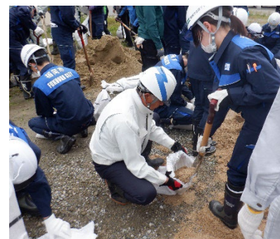
土のう製作の様子