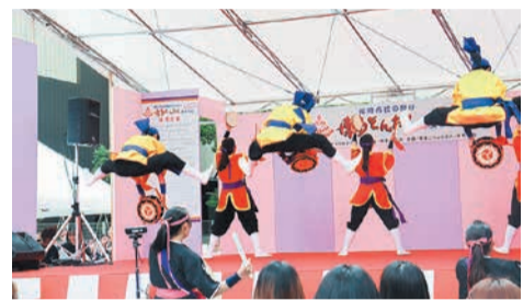
琉球國祭り太鼓の迫力ある演技(昨年)

博多松囃子が表敬 博多松囃子は、中世から正月祝賀の行事として博多の人々に受け継がれてきました。現在は、博多どんたくに合わせて行われています。 福祿寿・夫婦恵比須・大黒天を仕立てた「三福神」と、舞姫が舞を披露する「稚児流」が博多の寺社や企業・商店を回ります。訪問先では、三福神が「祝うたア」と叫び、それぞれのしきたりで祝います。