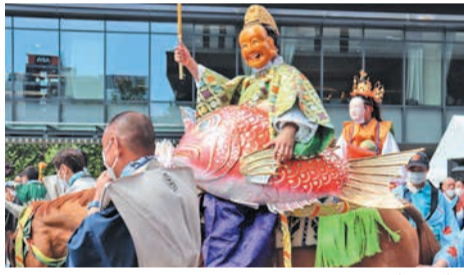
男恵比寿と女恵比寿が馬に乗って訪問(昨年)