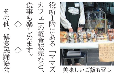
美味しいご飯も召し上がれ(昨年)