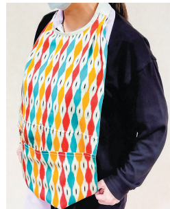
④片手でも着けやすい「食事用エプロン」を作ります