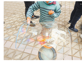
過去の同イベント

シャボン玉ができる原理や割れにくくする方法を学びます。☎5月25日(土)午前10時30分～正午、午後1時30分～3時 小学生(保護者同伴) ☎20人(抽選) ☎無料 ☎電話かメール(☎mamoroom@fch.chuo.fukuoka.jp)に応募事項と希望時間を書いて、5月2日午前10時～9日に同施設へ。1通3人まで。当選者にのみ通知。