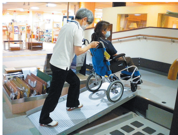
②車いすの使い方を学べます

☎電話かファクス、メール(☎f_kaigon@fukuwel.or.jp)に応募事項と①⑦は希望日も書いて、5月1日以降に同センターへ。来所でも受け付けます。