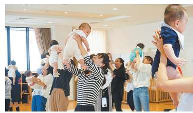
音楽やリズムに合わせた「ふれあい(スキンシップ)あそび」

読み聞かせや体操、季節の工作などを行います(火～金曜日に実施)。曜日によって時間・対象年齢が異なります。詳細はホームページで確認を。