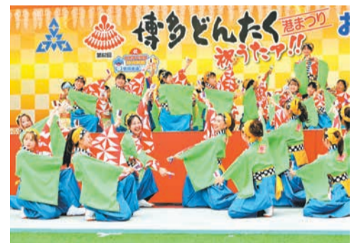
さまざまな演技が披露される各演舞台では、参加者の皆さんの笑顔がはじけます

ホームページ「モバイルどんたく(通称・モバドン)」で、各プログラムが確認できるほか、市内各所で行われる「モバドン」