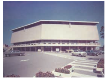
開館当時の福岡市民会館

そこで、同館の記録を残すため、市民の皆さんから同館にまつわる写真や動画、エピソードを募集します。