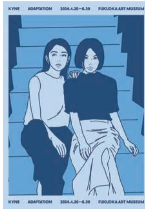
同展のキービジュアル

開催中～6月30日(日)午前9時半～午後5時半(最終入館は閉館の30分前まで) 市美術館 ☎714-6051 ☎714-6071 料 一般1,700円、高大生1,000円、中学生以下無料 ※65歳以上は1,500円(月曜日) ※4月29日(月・祝)、5月6日(月・休)は開館、4月30日(火)、5月7日(火)は休館