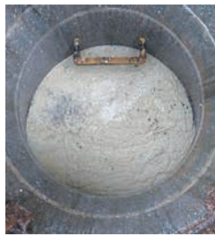
マンホールへ流出した油脂類の堆積で閉塞寸前の排水管