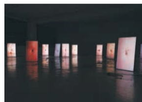
[市長賞]ソー・ソウエン《お臍(へそ)と呼吸》2022年

期5月19日(日)午後2時~4時(30分前開場) 所1階ミュージアムホール 定180人(先着) 料無 料 ※8面に記事。