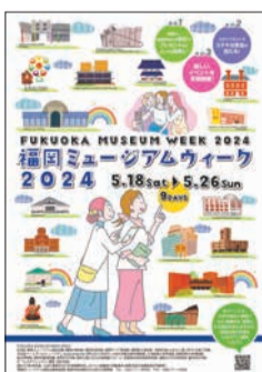
同イベントのチラシ

施設情報やイベント、スタンプラリーなどの詳細は、市ホームページ(「福岡ミュージアムウィーク2024」で検索)に掲載しています。問い合わせは、文化振興課(☎711-4969 内 ☎711-4354)へ。