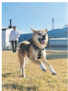
ご機嫌なサマー (博多区 20代)

(博多区 30代) 好きなだけ食べます。 おいしいものを食べる時がやっぱり一番です。忙しい仕事の事や、ストレスがたくさんたまって、おいしいものを口に入れた瞬間に、笑顔があふれます。最近ではいちご狩りに行って甘くいまっ赤ないちごが食べられて幸せでした。