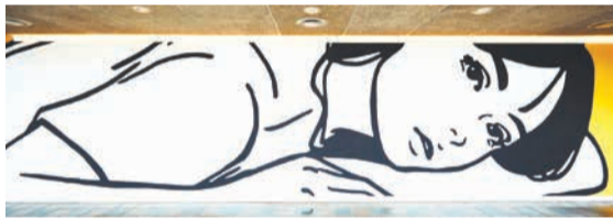
本展で同作の展示はありません