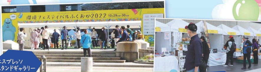
エスプレッソ スタンドギャラリー TAGSTA様

環境フェスティバルふくおか2022では、出店者の方が 食物の皮や芯などの食品廃材でできたお皿や お米でできたストローを使用しました。