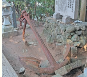
桜坂駅近くにある金刀比羅神社のいかり

〒810-8622 中央区大名二丁目5-31 区役所代表電話 ☎714-2131