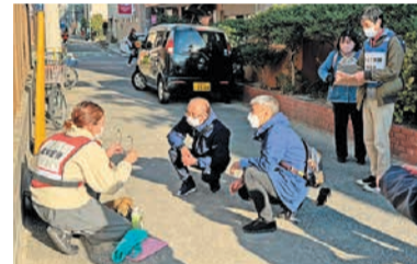
ポイントを参考に、声を掛ける参加者

必要があります。認知症は、誰もがなり得る脳の病気です。認知症になっても、本人やその家族を地域で見守り、支え合い、安心して暮らせる社会を目指していく必要があります。