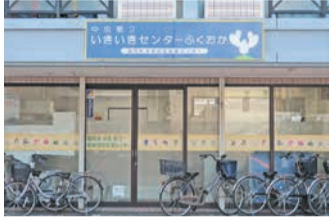
中央第2いきいきセンターの外観

「いきいきセンターふくおか」は高齢者が住み慣れた地域で安心して暮らせるよう、市が設置した相談窓口です。区内には5カ所あります = 下表参照。