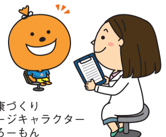
市健康づくり イメージキャラクター よかろーもん

☎3月4日(月)午後1時30分～3時(受け付けは1時から)☎あいれふ5階保健指導室(舞鶴二丁目)☎区内に住む第1子の乳児(昨年12月～今年2月生まれ)とその保護者☎先着16組程度☎無料☎2月28日(木)までに電話か区ホームページから申し込みを。問区地域保健福祉課 ☎718-1111 ☎734-1690