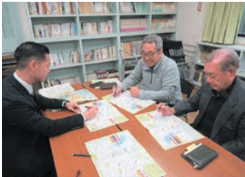
話し合いながらマップを作成しました(草ヶ江校区)

安全安心マップには、地域の災害リスクや避難所を記したものの、防犯情報や交通に関する危険箇所を記したものがありません。ぜひご活用ください。