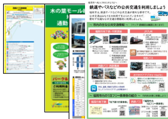
【転入者用 配布資料】

転入者へのガイドブック等の配布や、小学校の教育課程での意識醸成など、 公共交通利用に関する啓発や行動を考える機会を創出する取組み