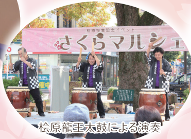
松原龍王太鼓による演奏