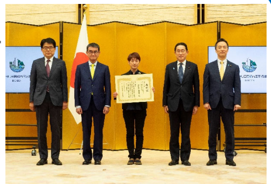
Digi田甲子園 2023 表彰式での記念撮影 (3月6日 首相官邸にて)

「防災アプリ『 ツナガル+(プラス) 』が 政府主催の「 Digi 田(デジでん)甲子園 2023 」で 地方公共団体部門 ベスト4 に輝きました。