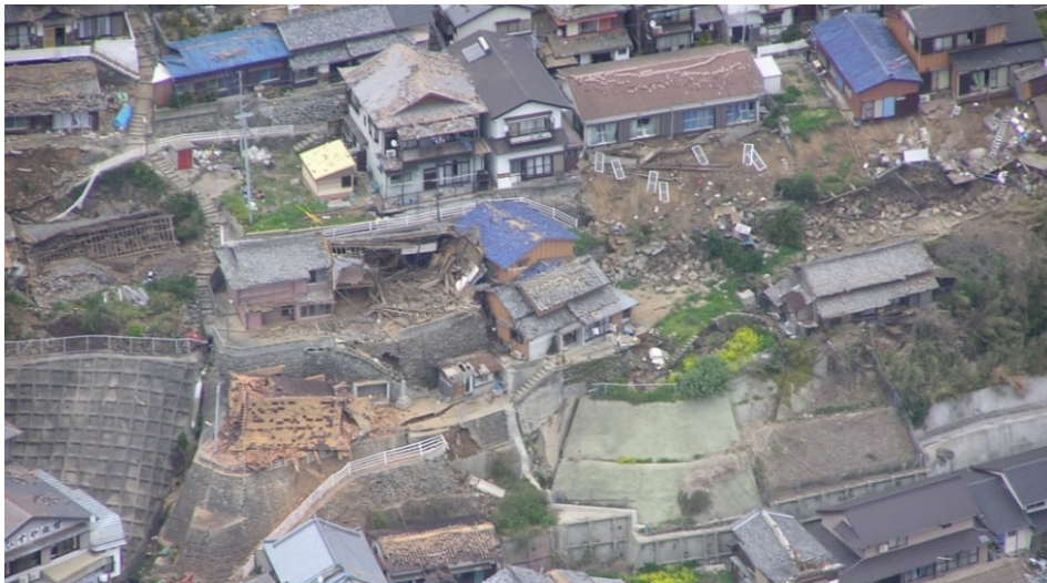
平成17年3月20日福岡県西方沖地震による被害状況（玄界島）