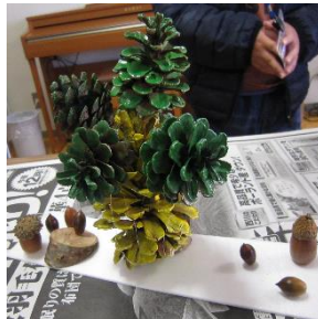
どんぐり松ぼっくり工作