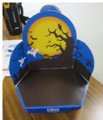
ペーパークラフト