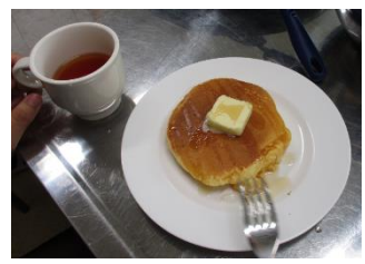
ホットケーキ作り