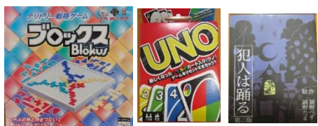
ボードゲーム・カードゲーム