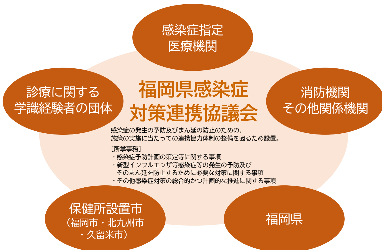
図2. 福岡県感染症対策連携協議会

※2 PDCA サイクルとは、「Plan（計画）→ Do（実行）→ Check（評価）→ Action（改善）」という一連のプロセスを繰り返し行うことで、改善や効率化を図る手法です。